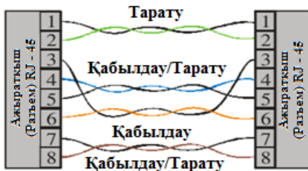
33 - сурет. 100Base-T4 спецификациясындағы төрт бұрмалау жұбы

Бұндай түрімен әр бұрмалау жұбына деректерді 33,3 Мбит/с жылдамдығымен жіберу керек, сондай ақ UTP 3 дәреже мүмкіндіктерін жоғарлатады. Сондықтан бұл спецификацияда кодтау әдісі қолданылады 8В/6Т, 4В/5В салыстырғанда тар спектр сигналымен ие болады. Әр 8 бит ақпараты алты үштік сандармен кодтайды (үштіктермен). Көрсетілген шаралар дерктерді 100 Мбит/с үш бұрмалау жұбымен UTP 3 дәреже жылдамдығымен жіберуге рұқсат береді.