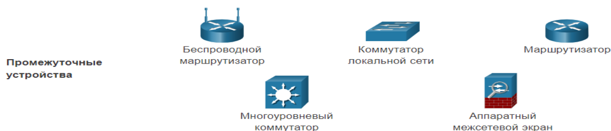
11-сурет. Packet Tracer бағдарламасындағы құрылғылардың белгіленуі

Желідегі қолданылатын аралық құралдар. 11-сурет