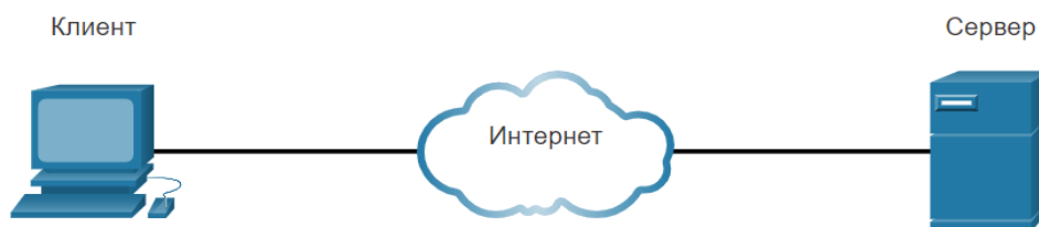
9 – сурет. Бағдарламалық құралдармен клиенттардың байланысы

Суретте серверден ақпаратты сұрауға және көрсетуге арналған бағдарламалық құралдармен клиенттардың байланысын көре аламыз 9-сурет.