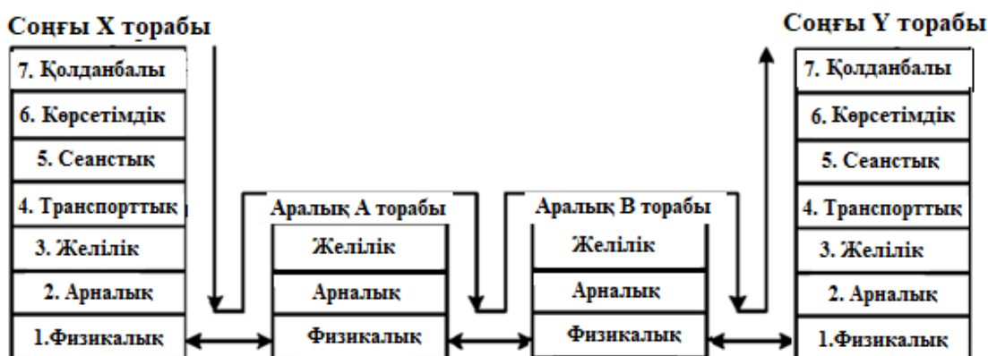
8 - сурет. Хабарламаның желі бойынша таралуы

OSI моделінің төменгі үш деңгейінде аппараттық бағдарламалық құралдар функциялайтын болғандықтан, хабарламаны жөндеу жоғары жылдамдықта жүргізіледі. Жоғарғы деңгейлерде бағдарламалық құралдарды функциялайды, бұл жөндеу уақытын (кідіріс) жоғарылатады. Жоғарыда көрсетілген үлгілерде екі соңғы тораптар өзара әрекеттескен болатын. Сондықтан шығу көзінің торабында құрылған хабарлама барлық жеті деңгейден ұзақ уақыт кетіріп өтті. Шынайы желілерде хабарлама бір шеткі тораптан келесіге дейін коммутатор, маршрутизатор сияқты аралық құрылғылардан өтеді. Сондықтан кідіріс уақытын азайту үшін (тез әрекеттілікті көтеру) аралық құрылғыларды хабарлама тек қана төменгі үш немесе екі құралдармен өңделеді (8-сурет).