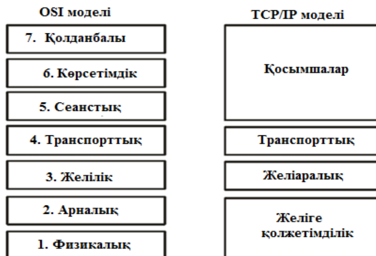
7 - сурет. OSI және TCP/IP модельдері

Әрбір деңгейдегі ақпараттық бірліктердің атауы, олардың көлемі және басқа да инкапсуляция сипаттары мәліметтердің бірліктер хаттамасына сәйкес жүзеге асырылады (Protocol Data Unit - PDU). Сонымен, жоғарғы үш деңгейде – бұл хабарлама ( Data ), Транспорттық деңгейде 4 - сегмент (Segment) , желілік деңгейде 3 - десте (Packet) , Арналық деңгейде 2- кадыр (Frame) , физикалық деңгейде 1 – биттердің тізбегі. Жеті деңгейлік OSI моделінен басқа іс жүзінде төрт деңгейлі TCP/IP моделі қолданылады (7-сурет).