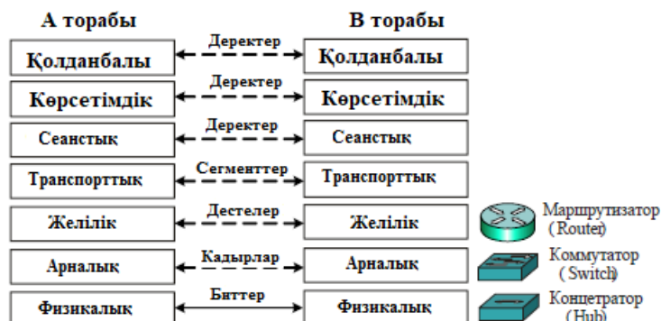
5 - сурет. Сәйкесінше деңгейлердің ақпарат құралдары мен бірліктері

Әрбір желілік технологиялар үшін 5 суретте көрсетілген өзінің хаттамалары және өзінің техникалық құралдары бар. Берілген белгілерді Cisco фирмасы енгізген және олар ортақ қабылданды.