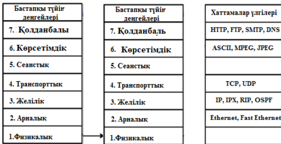
4 – сурет.. Жеті деңгейлі ISO/ OSI моделі

4 - суретте OSI моделінің әр түрлі деңгейлерінде тораптар әрекеттесуінің хаттамаларының үлгісі көрсетілген. Тораптар ішіндегі деңгейлердің әрекеттесуі деңгей аралық интерфейс арқылы жүзеге асырылады және әрбір төменгі деңгей жоғарғысына қызмет көрсетеді.