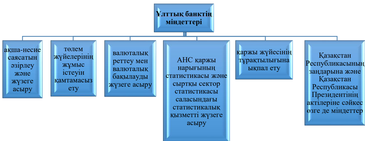
Сурет 9. Қазақстан Республикасы Ұлттық Банкінің міндеттері

Ұлттық Банктің негізгі миссиясы Қазақстан Республикасындағы бағалардың тұрақтылығын қамтамасыз ету болып табылады. Миссияны іске асыру үшін Ұлттық Банк 9 суретте көрсетілген міндеттерді қояды.