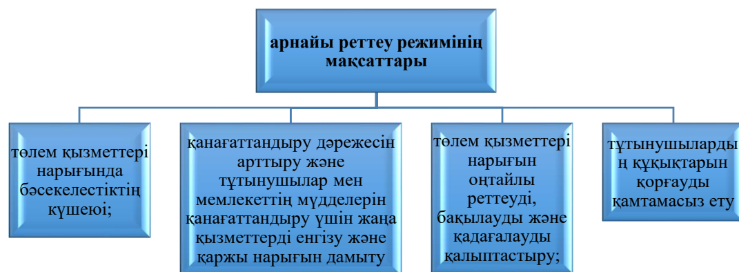
Сурет 12. Арнайы реттеу режимінің мақсаттары

Реттеудің ерекше режимі 12-суретте көрсетілген белгілі бір мақсаттарға қол жеткізуге бағытталған