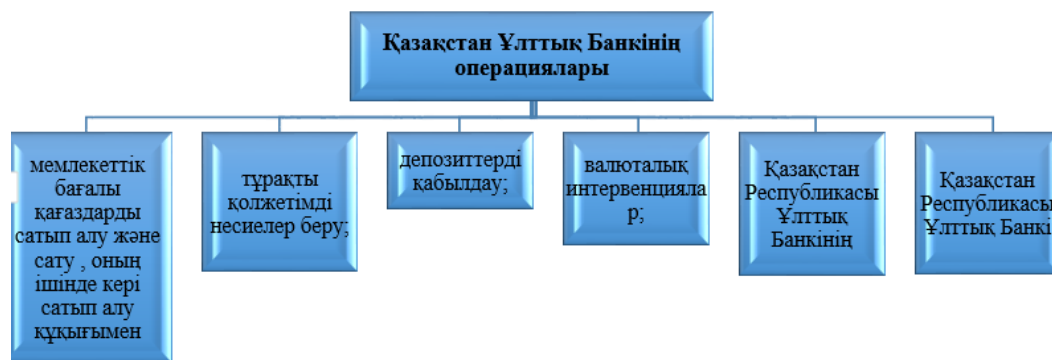
Сурет 11. Қазақстан Ұлттық Банкінің операциялары

Ақша-несие саясатын жүзеге асыру мақсатында Қазақстан Ұлттық Банкі мынадай операциялар сериясын жүзеге асырады (11-сурет)